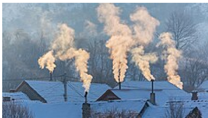
Soused začal šetřit. Topí vším, co jde spálit, a my se dusíme kouřem