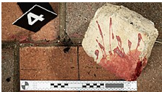
Matka zabila svého postiženého syna. Vraždila z lásky i strachu

Přečtěte si další exkluzivní články z iDNES Premium